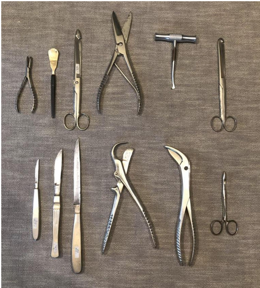
Autopsiemateriaal, gebruikt door Dr.Sano.