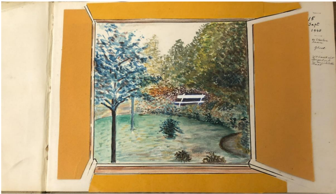
Schetsboek van Dr.Sano met tuinzicht doorheen het raam, geschilderd in 1944. Verzameling Letterhuis Antwerpen.