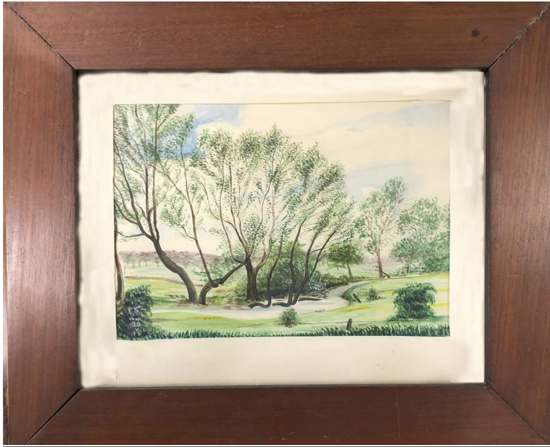
Landschap in Engeland .WATERVERFSCHILDERIJ vervaardigd door Dr.Sano in 1917 Verzameling Letterhuis Antwerpen.